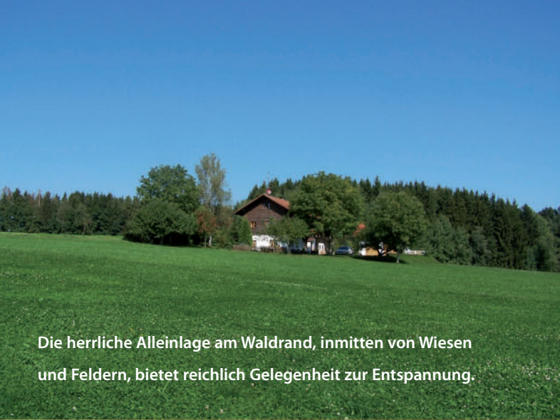
Die herrliche Alleinlage am Waldrand, inmitten von Wiesen und Feldern, bietet reichlich Gelegenheit zur Entspannung.